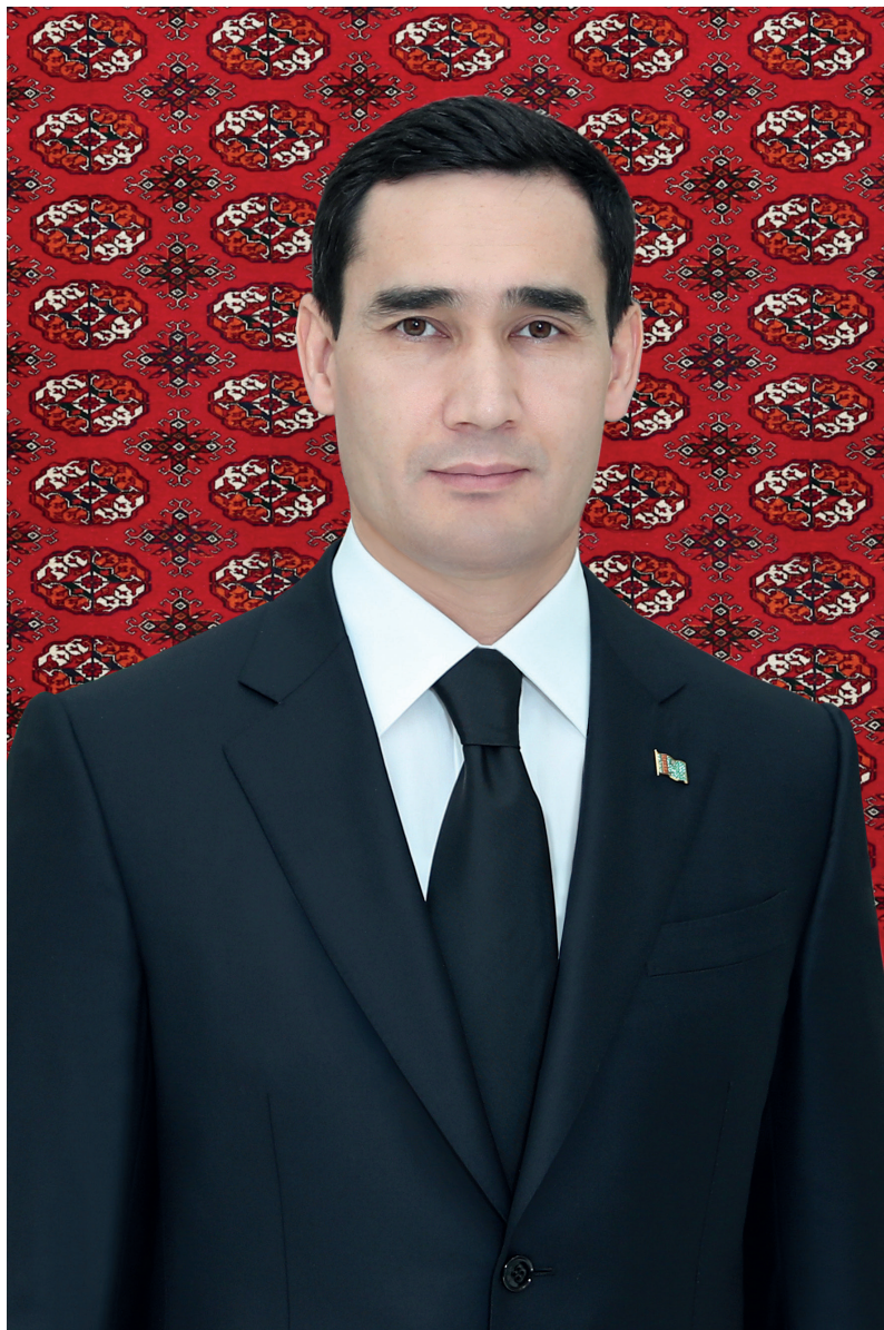
TÜRKMENISTANYŇ PREZIDENTI SERDAR BERDIMUHAMEDOW